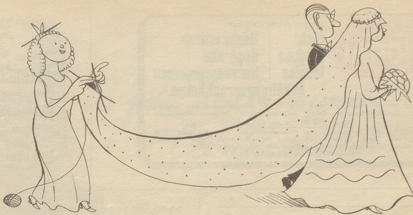
Die fleißige Brautjungfer

Die großen Vier! Wie geschickt die Bezeichnung erdacht ist! Wenn man sie umkehrte, hieße es: Die vier Großen. Und die Spaßvögel würden scheinheilig fragen: Die vier großen was? Bobby Bums