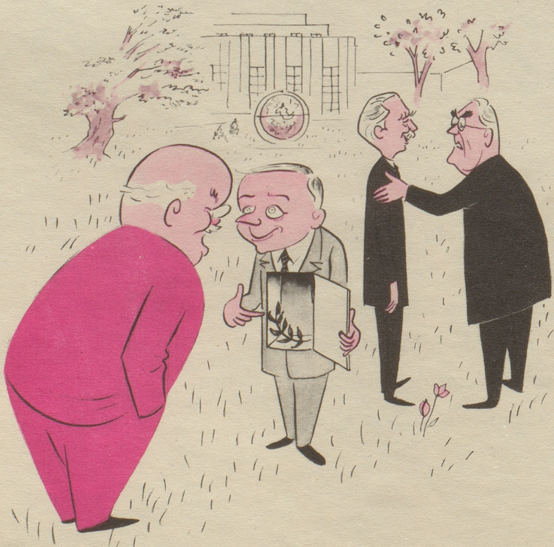
„— ich will offen mit Ihnen reden!“