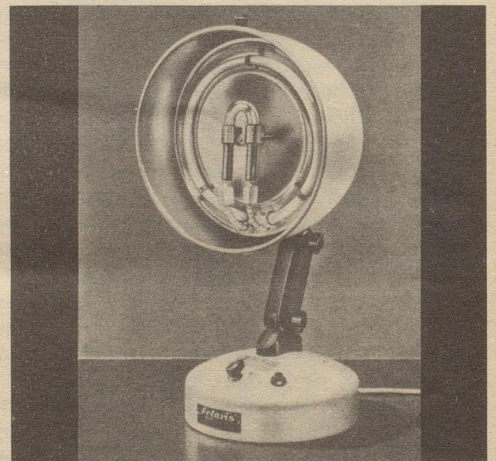
(Solaris, Quarzlampe mit Infrarot komb.)

Wenden Sie sich vertrauensvoll an uns. Als großes Zürcher Spezialgeschäft für Quarzlampen, haben wir eine enorme Auswahl an verschiedenen Markenlampen in allen Preislagen und bieten zudem beste Gewähr für eine fachmännische, neutrale Beratung.