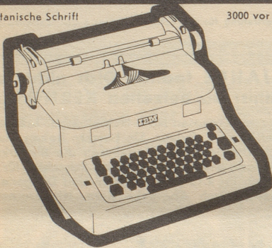
3000 vor Chr.