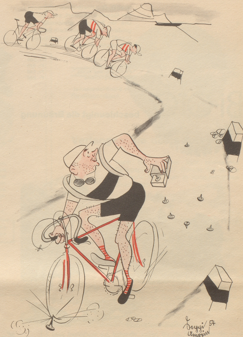
Wer andern eine Grube gräbt fährt selbst hinein

Hauptme, fascht überschlage. Vo do also isch das Gschmäggli cho! Und was erscht zum Vorschyn cho isch! Jo, die Mueter het öbbis Schöns agschteilt gha.