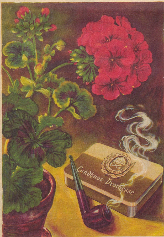
Ein Pfeifentabak mit natürlichem blumigem Aroma und auffallender Milde. Import-Klasse

„Chasch du dir das erchläre, wie dä det äne i dr Luft cha dure laufe?“ „De Bosco hät nume vergässe d Brugg z zeichne.“