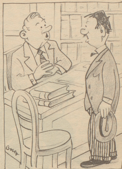
Auf dem Steueramt