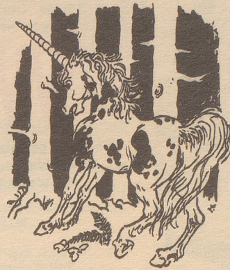
Das Einhorn und die «Horn am Munde».

Das Einhorn gab es leider nie im großen Reich der Zoologie. Es ist ein Pferd, ein Fabeltier und lebt drum nur auf dem Papier. In seinem Horn sah man vor Zeiten geheimnisvolle Fähigkeiten.