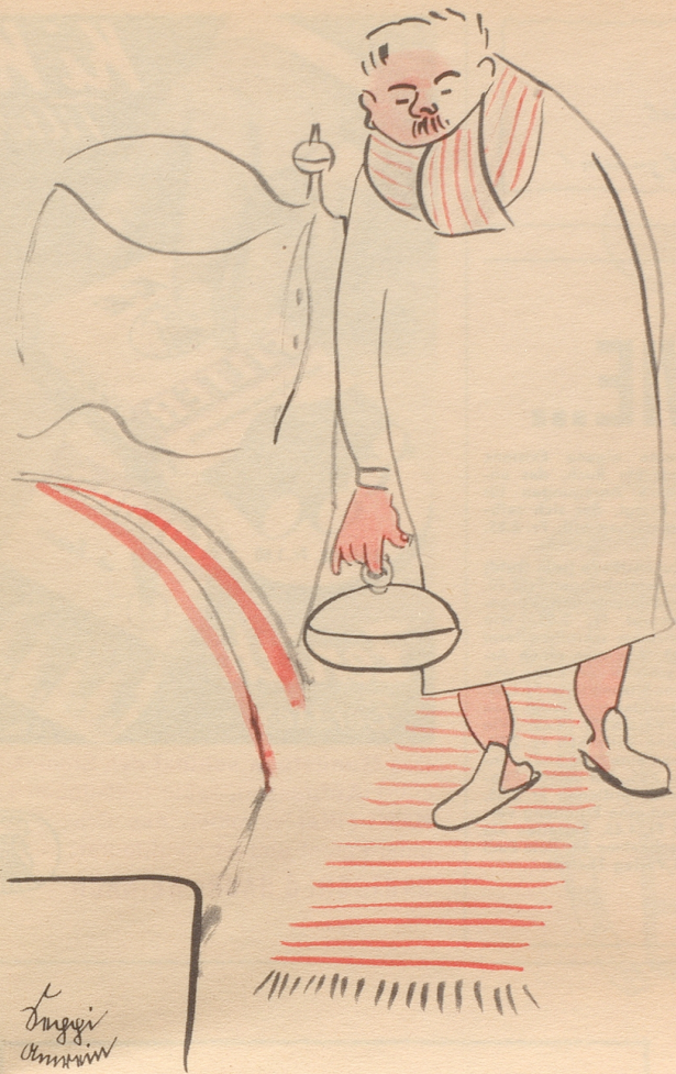
Curling auch im Sommer 1954