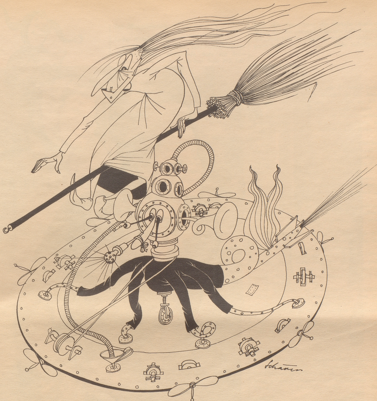
Hexerei — einst und jetzt

los ist mit Dir. Weshalb verewige ich Dich also?» In der Tat, das frage ich mich auch. Andere Leute stellen die Büsten von Beethoven, Goethe oder – Verzeihung – dereinst von Louis Armstrong auf ihre Kommoden und haben Kultur in der Wohnung. Jedermann, der bei ihnen eintritt, verbeugt sich im Geiste. Nicht so bei mir. Meine Büste strahlt lediglich den Schimmer der aufgestrichenen Bronze aus, und sich vor mir zu verneigen wird außer dem Schneider, wenn er mir alle paar Jahre eine Hose anmißt, wohl niemand in den Sinn kom-