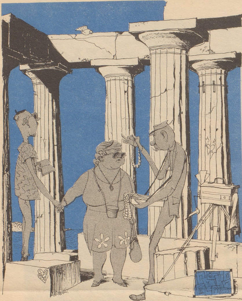
«Chumm Emmeli du weisch doch daß Chettehandel verboten ischt!»