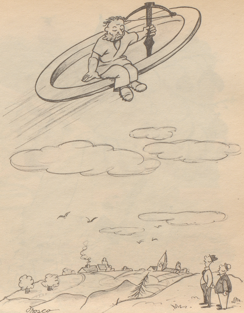
Fliegender Wilhelm Teller

Dann setzte er sich bescheiden hin und war sehr froh. Die Gesellschaft war es ebenso, und somit hatten beide Teile keinen Grund, nicht von Herzen weiterzufeiern und sich des Lebens zu freuen.