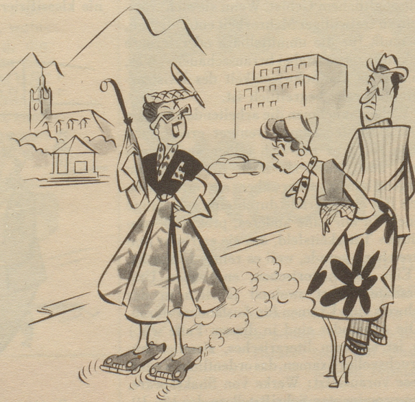
Die Kleinwagen werden immer kleiner.

Eine solche Marktanalyse wird jeweils in der ganzen Schweiz, in verschiedenen Alters- und Sozialklassen durchgeführt und die Fragebogen werden mittels des Lochkartensystems ausgewertet. Alle Marktfor-