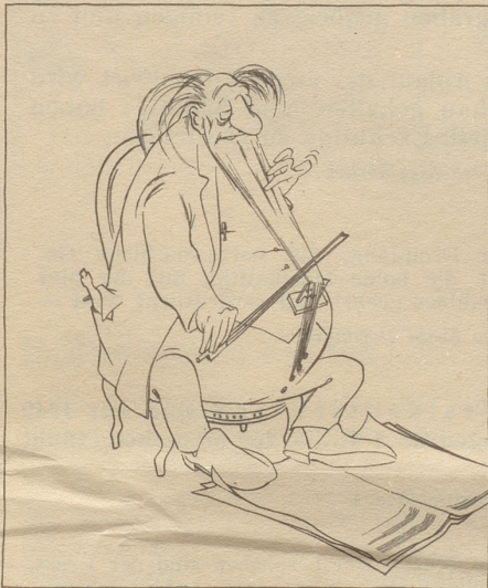
Illustrationsprobe aus «Gesammelte Zeichnungen»

«Man kann den Karikaturisten Giovannetti auf die Formel bringen: Bildhumorist mit groteskem Einschlag. Wie reich er an Einfällen ist, geht aus der Tatsache hervor, daß er mit Vorliebe in Zyklen zeichnet. Eine erste Erfindung weckt gleich eine ganze Reihe neuer Ideen und diese runden sich zu einem fröhlichen Romanchen, das den Beschauer ergötzt. Wie hat er die neuen Ritter, Räuber in Mexiko, konterfeit! In der grotesken Übertreibung liegt seine zeichnerische Stärke und auf dieser Humorebene liegt seine überwältigende Komik.» Solothurner Zeitung