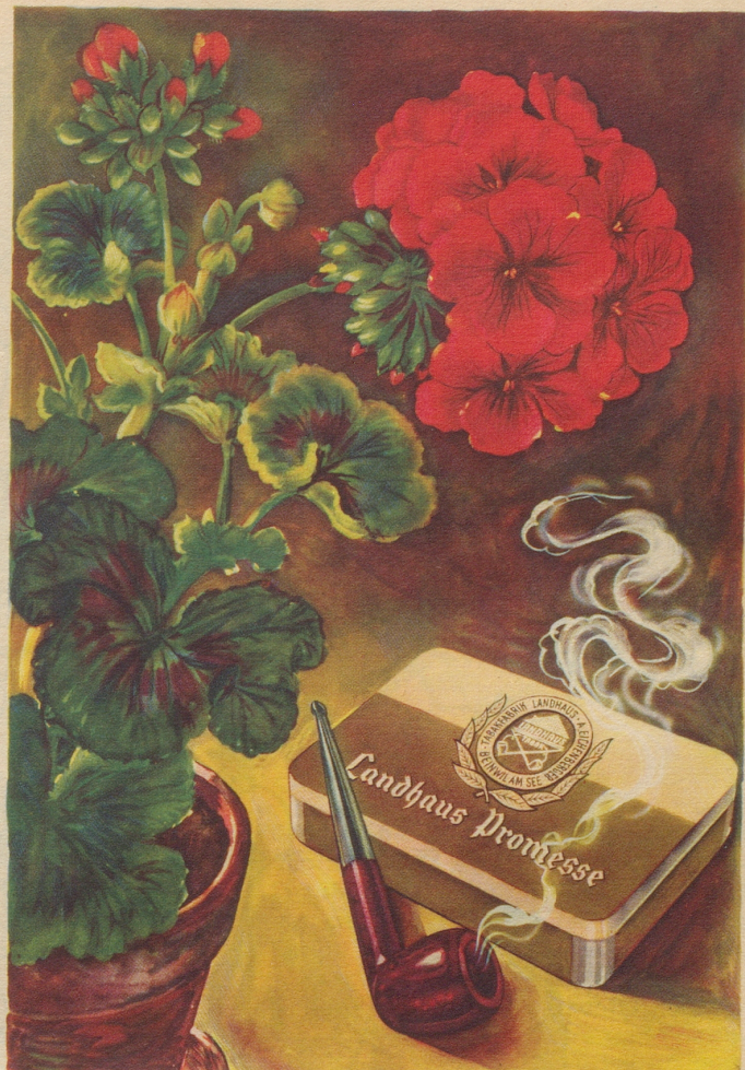
Ein Pfeifentabak mit natürlichem blumigem Aroma und auffallender Milde. Import-Klasse