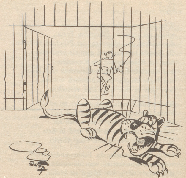
Angst vor der offenen Türe

Ob mit Seife oder Strom nach dem Rasieren Pitralon. Desinfiziert die Haut und verhindert Infektionen. Macht die Haut glatt und sauber, beseitigt Pickel, Pusteln und Mitesser.