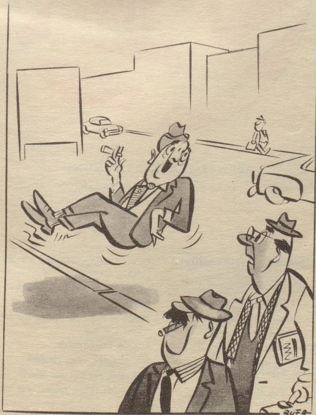
«Wieso ich schwebe? Ich bin ein vom Vertrauen seiner Wähler getragener Kantonsrat!»