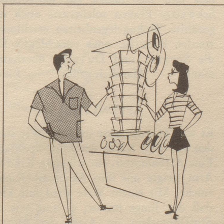
Der Kartenständer, eine günstige «Deckung» zu gegenseitiger Abschätzung

Dieser Adolph hat das Pulver erfunden! Ich nehme mir die Freiheit, absichtlich das Pulver zu sagen, indem mir diese Erfindung bedeutend erfreulicher scheint