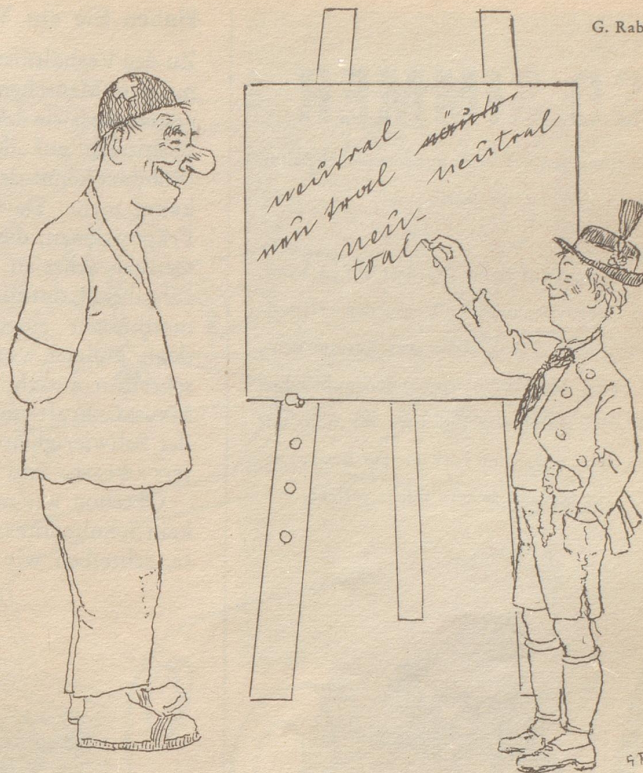
Das junge Oesterreich in der Schweizerschule