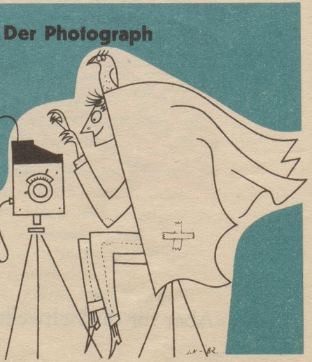
... er schreibt auf HERMES

Nicht nur die Wildwester scheinen die amerikanische Jugend von sieben bis siebzig Jahren zu begeistern. Seit dem Film «Three Coins in a Fountain» versucht man mit Tafeln «No Coins Please» das Auffüllen von Denkmalbrunnen mit Münzen zu verhüten. Rott