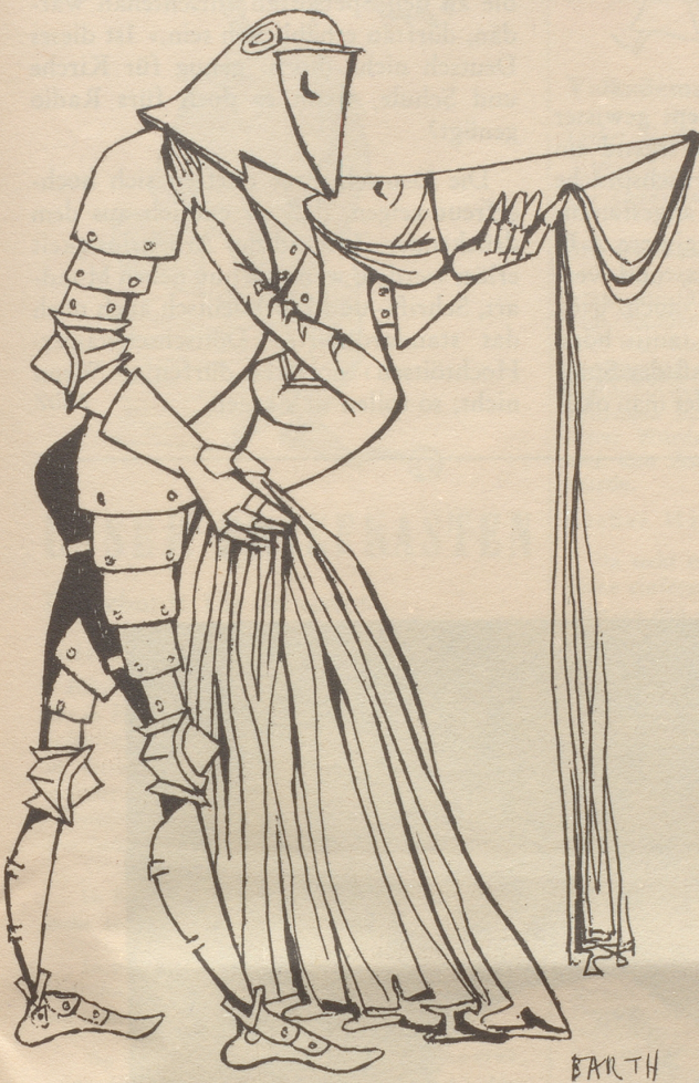
Kein Ritter ohne Dornen