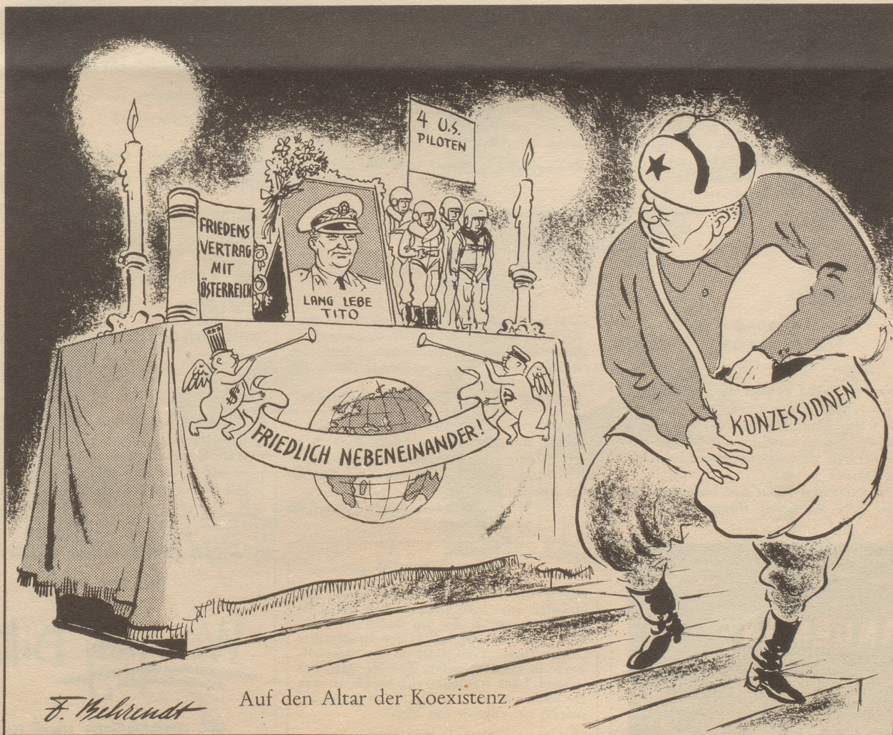
Auf den Altar der Koexistenz