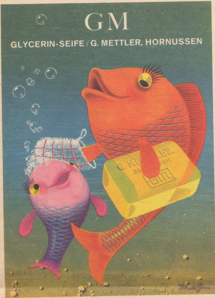
Jää, das isch si dänn!

Mark Twain, der berühmte Humorist, besuchte in Begleitung einiger Landsleute Italiens. In Genua angekommen, stießen sie mit einem Fremdenführer zusammen, der außerordentlich mitteilnehmend und von überbordendem Enthusiasmus war. Mark Twain und seine Freunde machten sich ein Vergnügen daraus, die Überzeugungen dieses armen Mannes nicht zu teilen und die herrlichsten Aussichtspunkte wie die schönsten Kunstgegenstände, die er ihnen zeigte, recht dürftig zu finden. Eines Tages glaubte der Führer etwas Gefundenes zu haben, was das Herz seiner amerikanischen Freunde rühren würde. Vor einer Vitrine, die ein kostbares Pergament zeigte, sagte er mit vor Erhebung zitternder Stimme: Ein Handschreiben des Christoph Kolumbus! Von wem? fragte kalt Twain, Christoph .. wie? Christoph Kolumbus. Wer ist Christoph Kolumbus? Aber meine Herren, Christoph Kolumbus – der Amerika entdeckt hat! Mark Twain zuckte mit den Schultern: Amerika entdeckt hat? Jemand hat also Amerika entdeckt? Was ist denn das wieder für ein altes italienisches Märchen? Aber mein Herr, das ist kein Märchen – das ist Geschichte! Twain wandte sich an seine Landsleute: Haben Sie jemals von einem Italiener gehört, der Amerika entdeckt hätte? Die Antwort wurde mit ganzem Ernst gegeben: Niemals haben wir davon gehört – nicht einmal von unseren alten Ammen. Sie sehen selbst, mein lieber Führer, begann Mark Twain