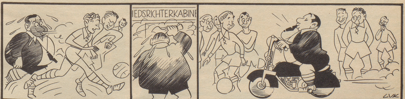
Der motorisierte Referee

Es war ja vorauszusehen, daß die Atombombe aus den Händen der Fuchs und der Pontecorvo in die Hände der Nachfolger Al Capones wechseln würde. bi