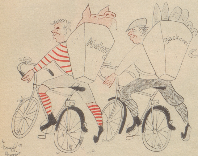
Montagsmorgen: Beginn des «Sechstagerrennens»