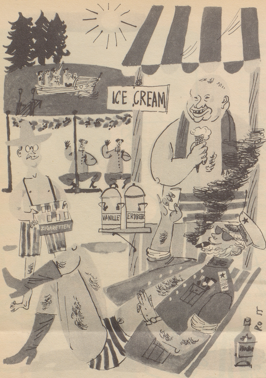
Der russische Ministerpräsident Marschall Bulganin veranstaltete auf seinem Landsitz ein großes Gartenfest für etwa 250 ausländische Diplomaten und ihre Familien.