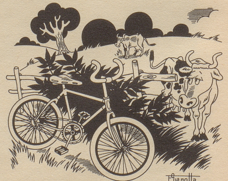
Die illegale Konkurrenz