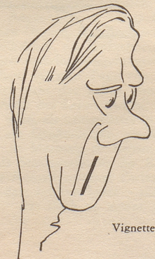
Vignetten: R. Doetzkies