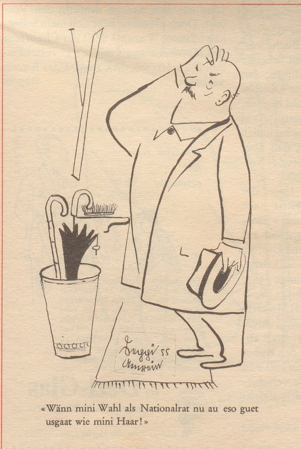
«Wänn mini Wahl als Nationalrat nu au eso guet usgaat wie mini Haar!»