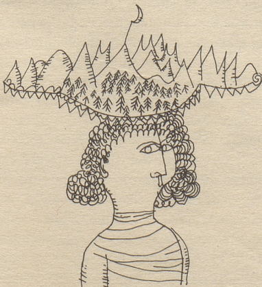
Für in die Berge