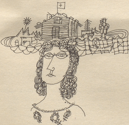
Unser Hut für die Engländerinnen