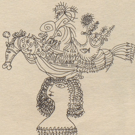
Der Hut für festliche Umzüge