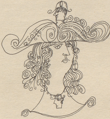
Der Hut für Marlon Brando-Schwärmerinnen