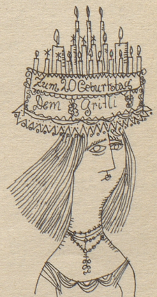
und zum Geburtstag