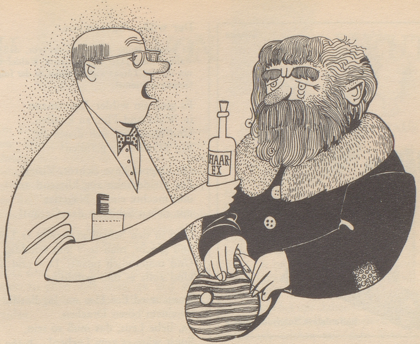
«Dreimal täglich auf die Kopfhaut massieren, und wenn Ihnen dann die Haare immer noch nicht ausgehen morgens, mittags und abends ein Eßlöffel voll vor dem Essen!»

Man sollte jetzt aufatmen und meinen, daß die Geschichte damit ihr Ende gefunden habe und unser Gastzimmer ein garantiert geruchloses Lager. Doch nein, so billigen Kaufes entkommt man der Industrie nicht. Als der Divan, frisch gefüllt, seinen Platz einnehmen wollte, erwies es sich, daß seine Seele stärker war als menschliche Kräfte. Er roch nicht anders als zuvor! Mit stockendem Atem rief ich die große Firma an, teilte ihr zagend, schonend mit, nun ja, es tue mir