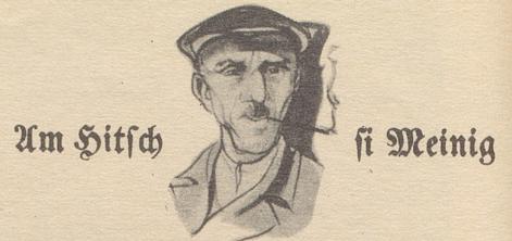
Am Hitzsch si Meinig