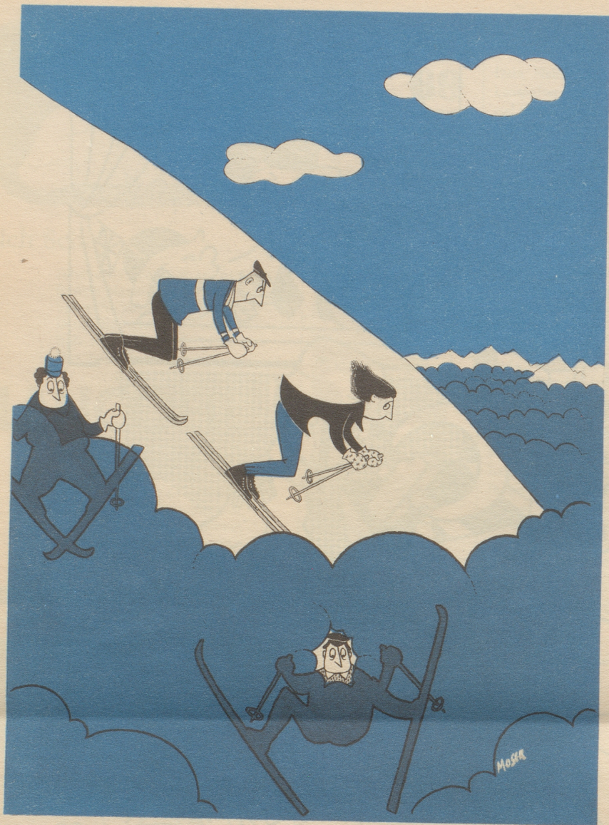
«Nach der Sune chunt Näbel — —»