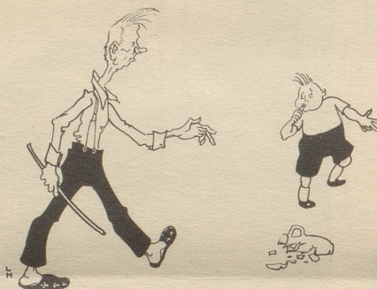
Der Sohn des Fußballers: «Foul!»

erstaunt über deine Unfähigkeit, deutsch zu schreiben. Hoffentlich lernst du Englisch besser im Kinderspiel.)