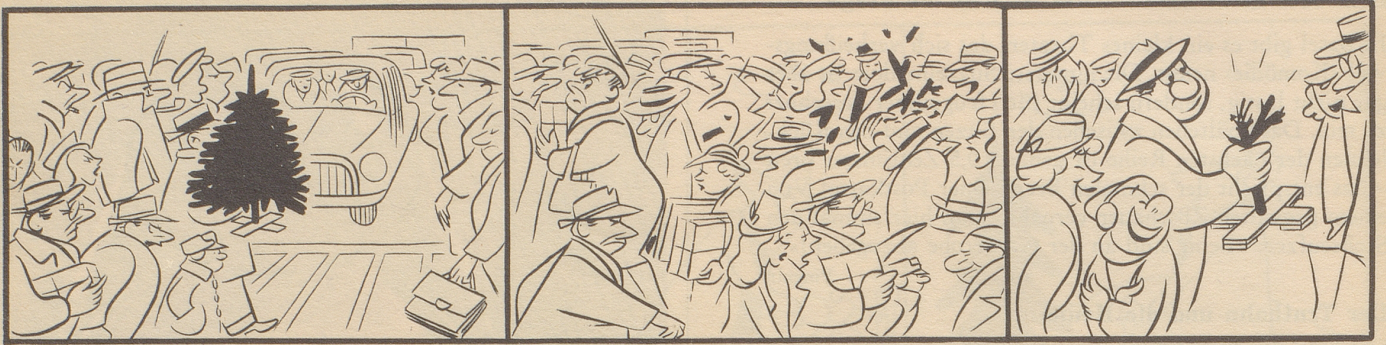
Ein Opfer des Verkehrs