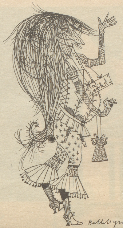
Alti Dante — ganz modern