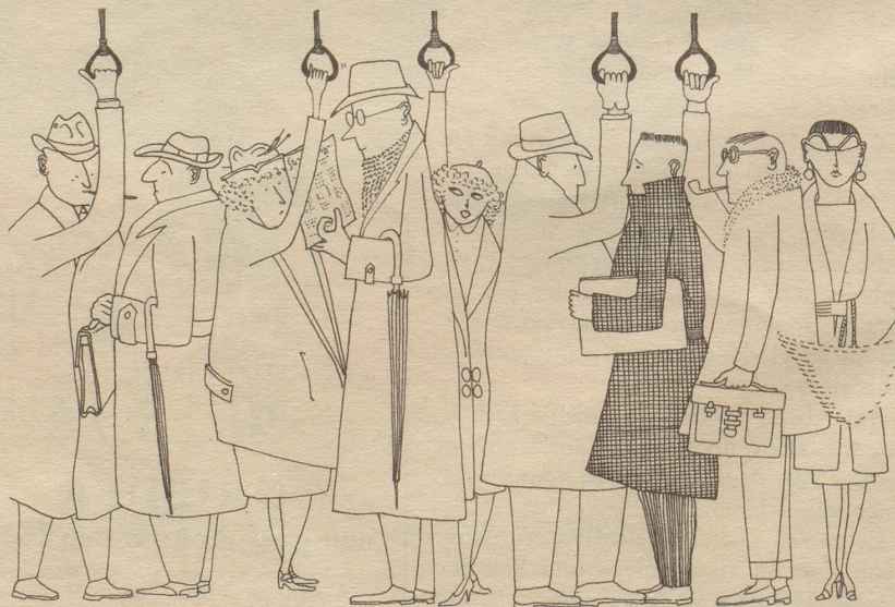
Jede Tag das Trück im Tram chönnt eim verteide...

Etwas Erfreuliches ist passiert: Einige Suppenfabrikanten haben entdeckt, daß wir Hausfrauen dem Kindergartenalter entwachsen sind. Sie haben beschlossen, ihre Produkte in Zukunft ohne «Zugaben» zu verkaufen, und sie haben dies durch eine Zeitungsmeldung kundgetan. Im Namen aller Hausfrauen, die ihre freien Stunden gerne sinnvoller ausfüllen als mit dem Einkleben von Märkli und dem Sortieren von Gutscheinen, möchte ich diesen Pionieren einer zeitgemäßen Verkaufspraxis von Herzen danken. Zu hoffen bleibt, daß auch alle, übrigen Fabrikanten von Lebensmitteln und Gebrauchsartikeln diesem Beispiel folgen werden. Es würde ihnen sicher keine Absatzverminderung einbringen. Welche Hausfrau wäre so naiv zu glauben, es handle sich bei diesen «Zugaben» um Geschenke? Wir wissen, daß wir bei unsern Einkäufen für alles mitbezahlen, selbst für das Glaskügeli, das aus dem Haferflockenpaket ins Birchermüesli rollt. Wozu also dieses