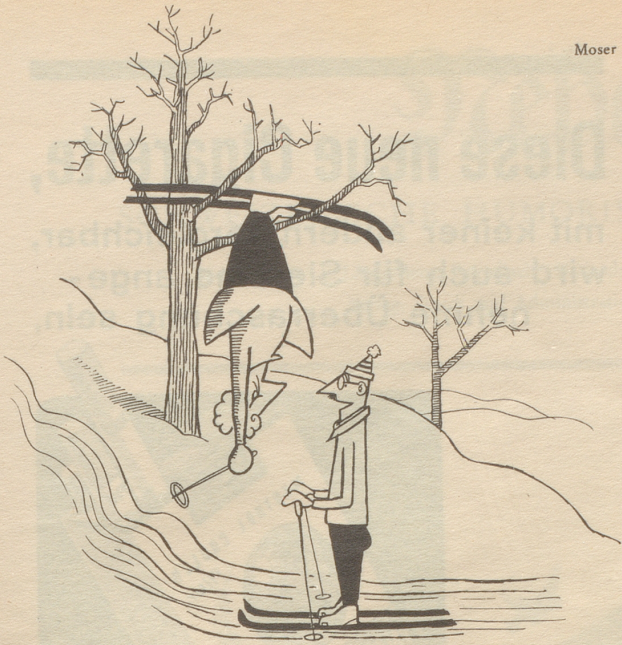
«Nicht schlecht, nicht schlecht! Vielleicht noch ein Ideeli weniger Lebhaftigkeit in den Bewegungen!»