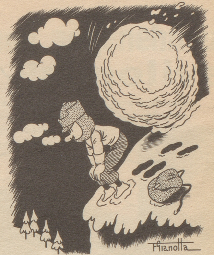
«Wie chum ich ächt da abe?»

Aus: George Mikes «A propos Ferien». Copyright by Cosmopress Genf und Diogenes Verlag Zürich