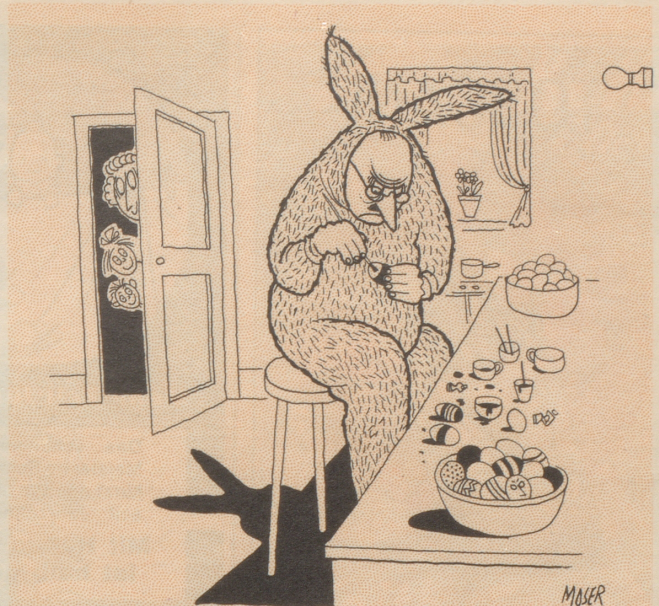
«... so Kinder, wenn ihr schön still seid, dürft ihr rasch das liebe kleine Osterhäschen beim Eiermalen sehen...»