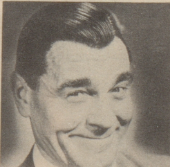
«Kein Spaß zuzusehen, wie einem die Haare ausfallen», sagt Herr D. «Seitdem ich Silvikrin verwende, fallen meine Haare nicht mehr aus und auch die Schuppen sind weg.»