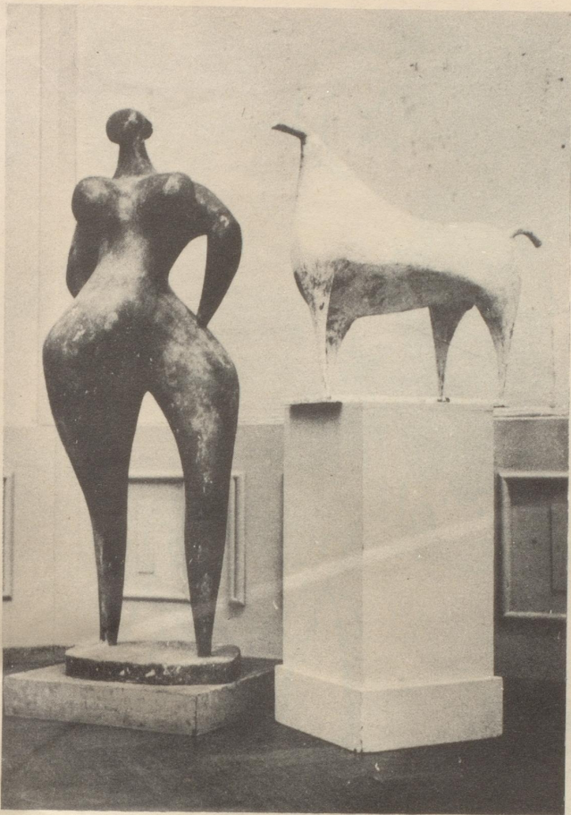
Die Eidg. Kunstkommission hat dem Bundesrat auch für das Jahr 1956 die Ausrichtung von Stipendien und Aufmunterungspreisen an Schweizer Künstler beantragt. Das obige Bild des Photopress zeigt zwei Stipendienarbeiten, die in Bern ausgestellt waren, sie sind mit «Pferd» und «Barbarische Venus» bezeichnet.

Was haben die Träger der heutigen Kultur für einen Grund, die Barbaren zu beleidigen?