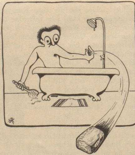
Höhepunkte des Lebens ...