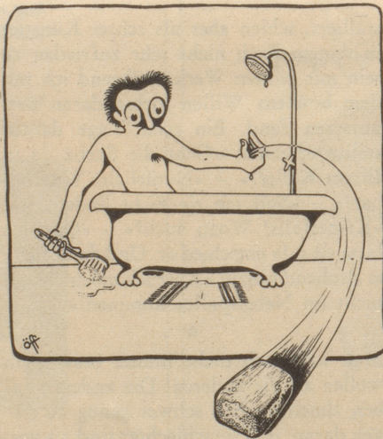
Höhepunkte des Lebens ...