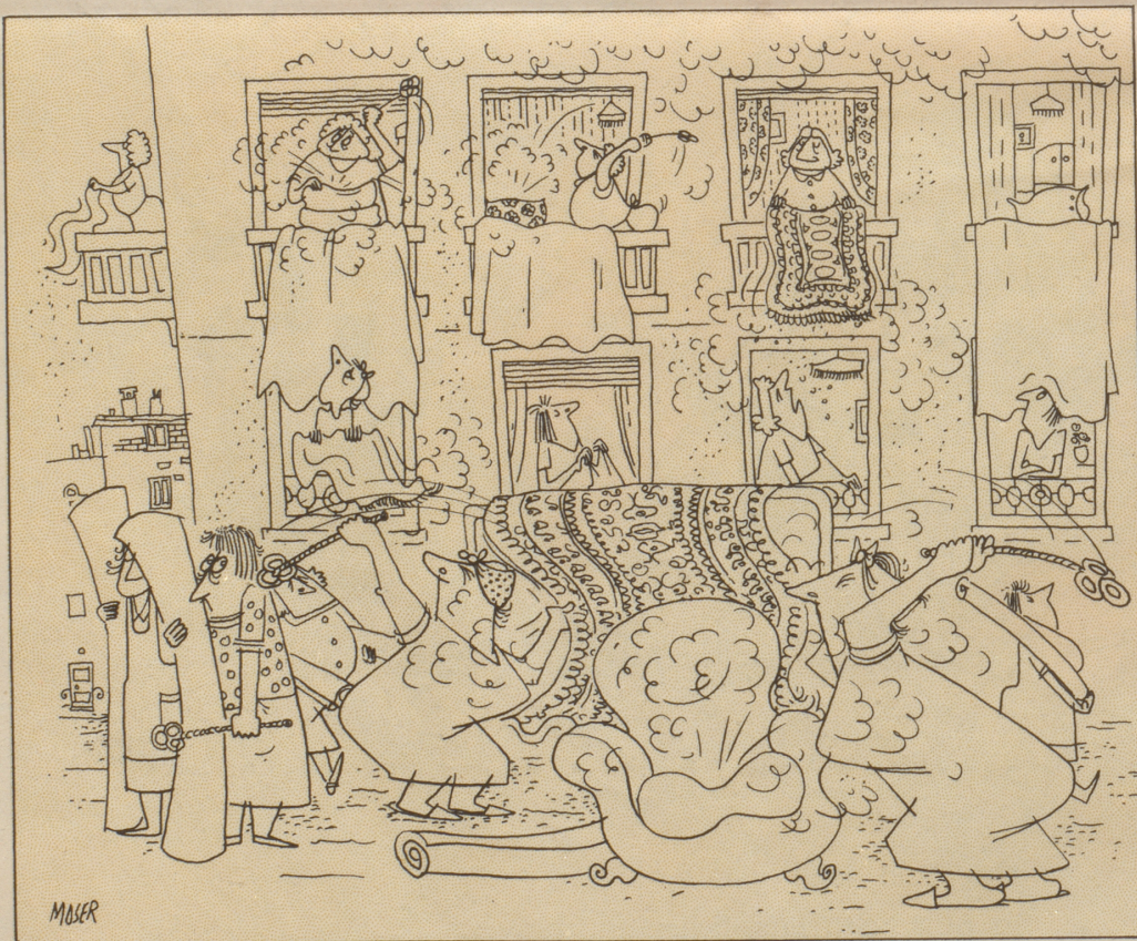
So sieht er sie, wenn er gefreit, zwecks Frühlingsputzerei im Garten. Bob