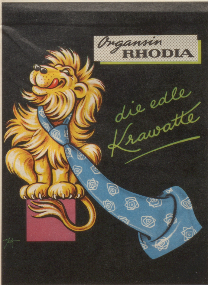
«Le Roi» des animaux porte la «Reine des Cravates»

Und die empfindsame und besorgte Ente verspeiste den fetten Wurm mit Behagen.