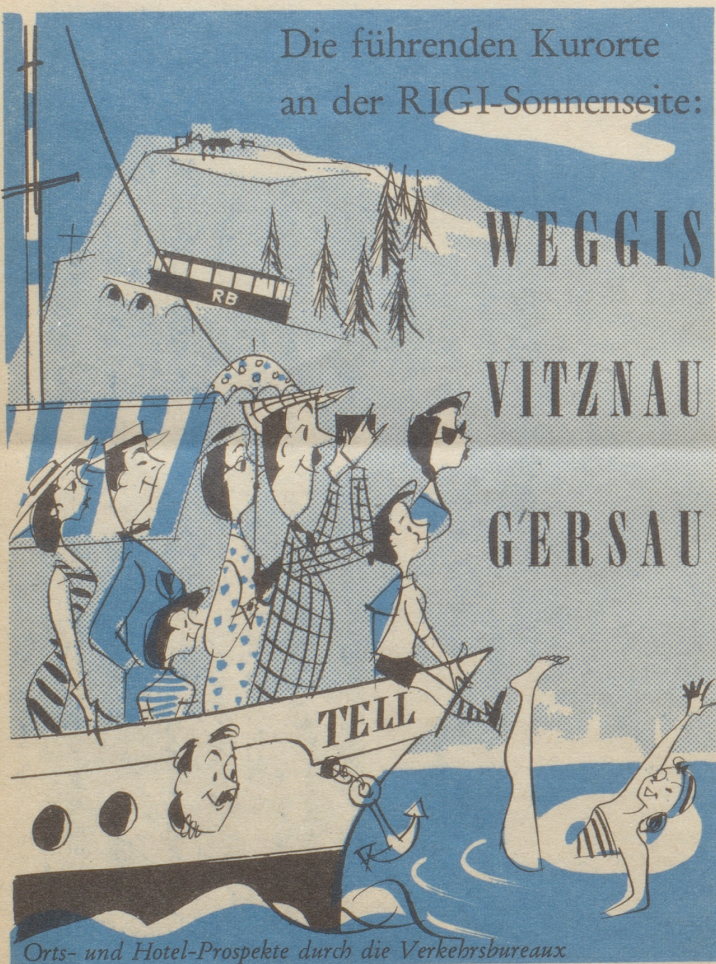
Orts- und Hotel-Prospekte durch die Verkehrsbureaux

Die führenden Kurorte an der RIGI-Sonnenseite: