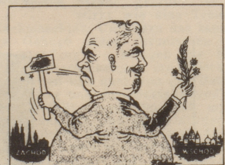
„Dwa oblicza” polityki sowieckiej (Nebelspalter, Szwaecjalia)

Schönen Dank für die Uebersendung der ganzen auf Dünndruckpapier gedruckten Zeitung. Zur Bestätigung schneide ich für unsre Leser das Bildchen aus.