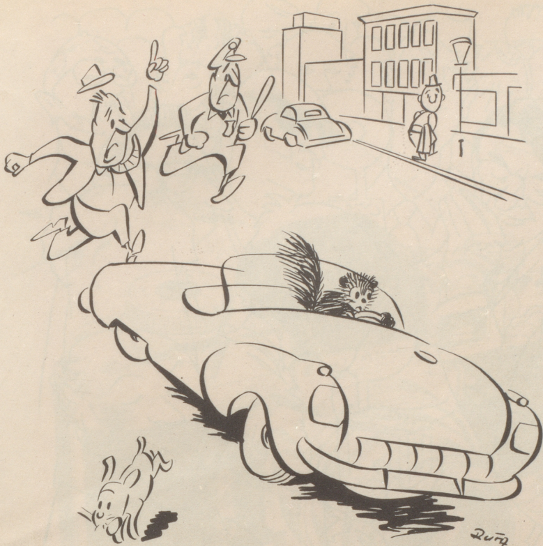
«Hebed en dä Auto-Marder!»