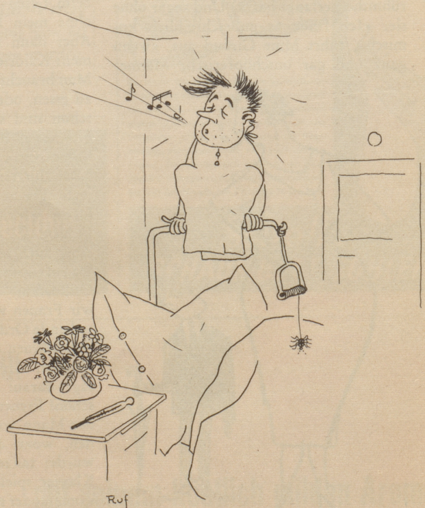
Em Patient im Zimmer 63 isch es wieder vögeliwohl!